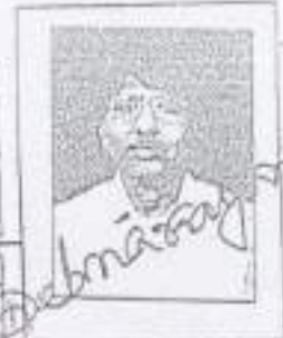
RIGHT HAND FINGER PRINT