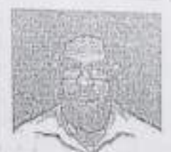
RIGHT HAND FINGER PRINT