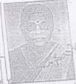
RIGHT HAND FINGER PRINT