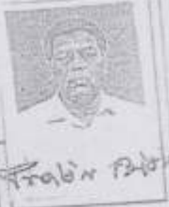
RIGHT HAND FINGER PRINT