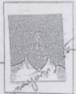
RIGHT HAND FINGER PRINT