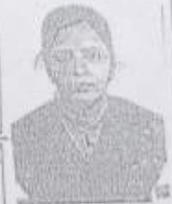
RIGHT HAND FINGER PRINT