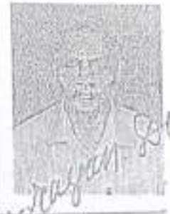
RIGHT HAND FINGER PRINT